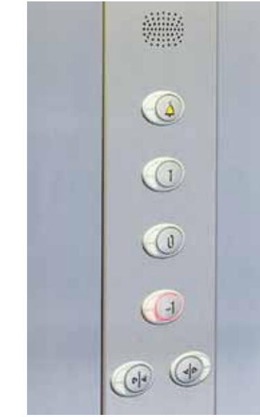
TABLEAU DE COMMANDE: Boutons lumineux ronds, carrés, ovales. Avec numéros en relief et en caractères Braille, sur demande.

PUERTAS: automáticas de piso y de cabina automáticas de cabina y semiautomáticas de piso o sin puertas de cabina con barrera de seguridad y semiautomáticas de piso.